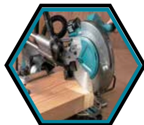
Ein LED-Licht wirft eine Schattenlinie vom Sägeblatt.