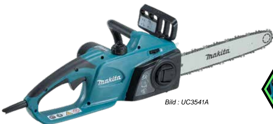
Bild : UC3541A