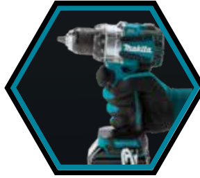
Kompakte und ergonomische Maschine.

Geliefert mit 2x Akkus 5.0 Ah, Schnellladegerät und Makpac-B Transportkoffer