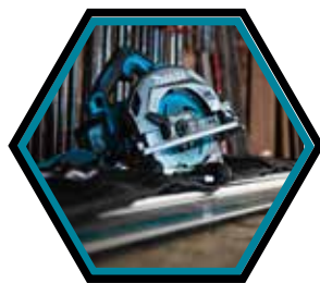
Passet ohne Adapter auf Führungsschiene.