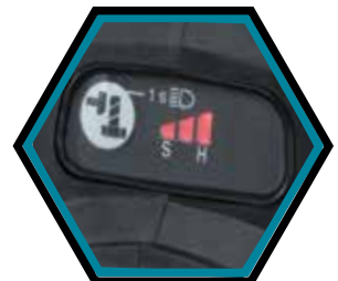
3 verschiedene Drehzahleinstellungen.